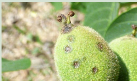
3 Symptomen op jonge vrucht