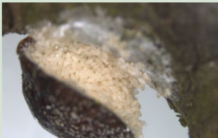
2 (ovipositie) aanwezigheid van eieren onder de schilden