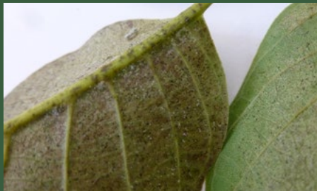
3 Symptoom op blad, verkleuring