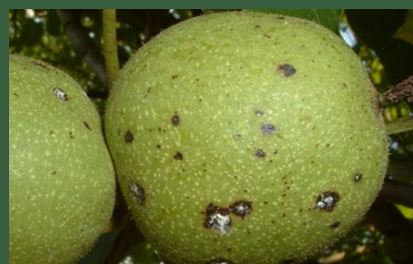
3 Symptomen op vrucht