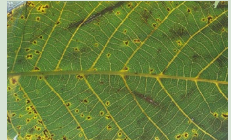
2 Symptomen op blad