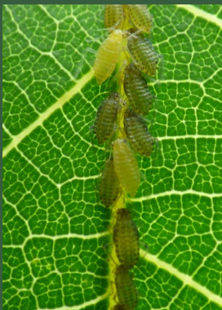
1 Panaphis juglandis (bovenzijde van het blad)

Ontwikkeling van een aanzienlijke hoeveelheid roetdauwschimmel door de aanwezigheid van honingdauw.