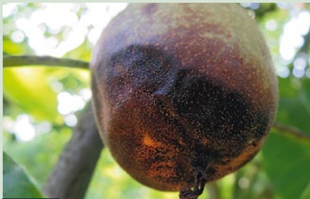
2 (voortplanting) droge donkere necrose, oranje sporulaties