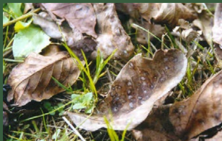
1 (geslachtelijke voortplanting) perithecia op dood blad, begin van uitsteeksels

Op bladeren: verschijnen van veelhoekige bruine vlekken die grijs worden. Op vruchten: verschijnen van kleine, ronde, oppervlakkige bruine vlekken met of zonder een witte vlek in het midden van de necrose. Deze vlekken kunnen groeien, maar slechts een beetje.