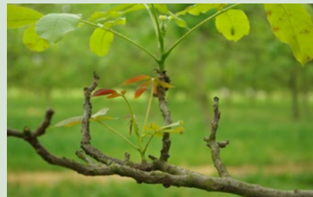
3 Schade aan takken, knopsterfte