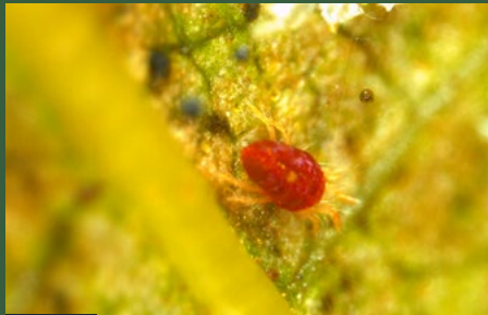
1 Volwassen rode mijt

De onderkant van de bladeren kleurt bruin: Diffuse bruine verkleuring langs de nerven ("visgraat"), daarna over het gehele blad. Aanwezigheid van rode of witachtige blaasjes, genaamd erinose.