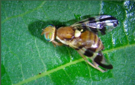
1 (G1-vlucht) opkomst van volwassenen

De bolster wordt geleidelijk zwart, waardoor de schaal bruin wordt en de kern wordt aangetast. Vroege aantastingen kunnen leiden tot vroegtijdige vruchtval.