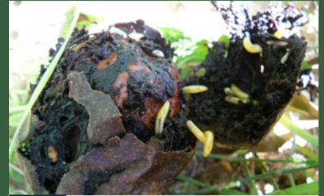
3 Larvengroei en verpopping in de grond