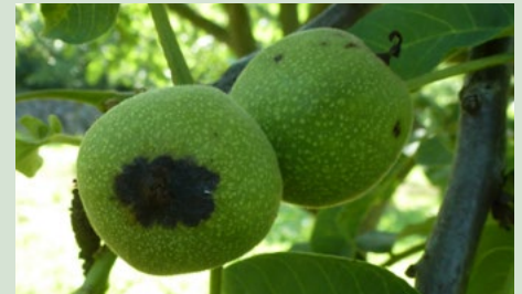
4 Symptomen op vrucht, olieachtige necrotische vlek