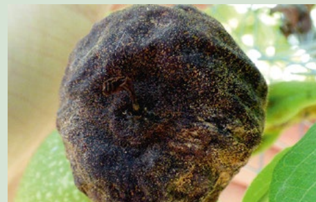
3 Gemummificeerde noten