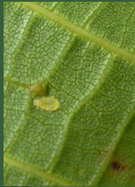
2 Kleine gele bladluis (onderszijde van het blad)