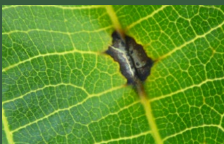
2 (necrose) symptomen op blad