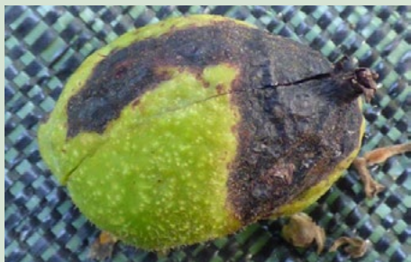
1 (ontwikkeling) droge, holle necrose die niet in de vrucht dringt

Progressieve necrose van de bolster, die er droog en hol uit ziet. De kern wordt over het algemeen niet aangetast. Vroegtijdige vruchtval.