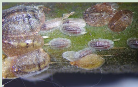
1 Groei van de larven

Bij zware aantastingen kan deze dopluis knopsterfte en taksterfte veroorzaken. De aanwezigheid van honingdauw bevordert de ontwikkeling van roetdauwschimmel.