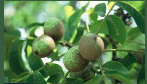
4 Symptoom op vrucht, verkleuring