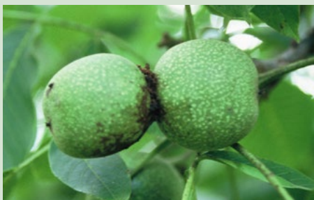
2 (ovipositie) aanwezigheid van uitwerpselen