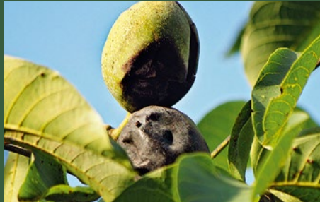
2 Vruchtschade: bruine vochtige vlek