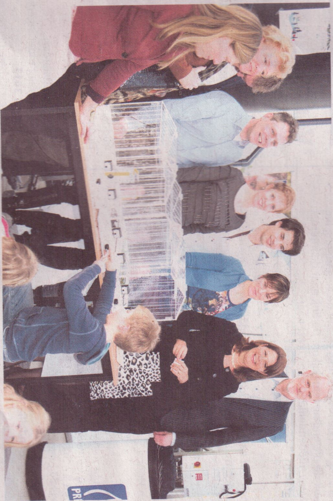
Voormalig minister bij onderwijsrelatiedag

Kas in de Klas De eerste Onderwijsrelatiedag